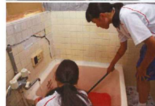
お化け屋敷の準備のために浴槽で「血のり」の作成(笑)準備段階から、もう怖い！